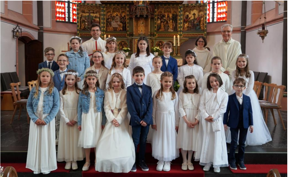
Erstkommunion in Kastellaun