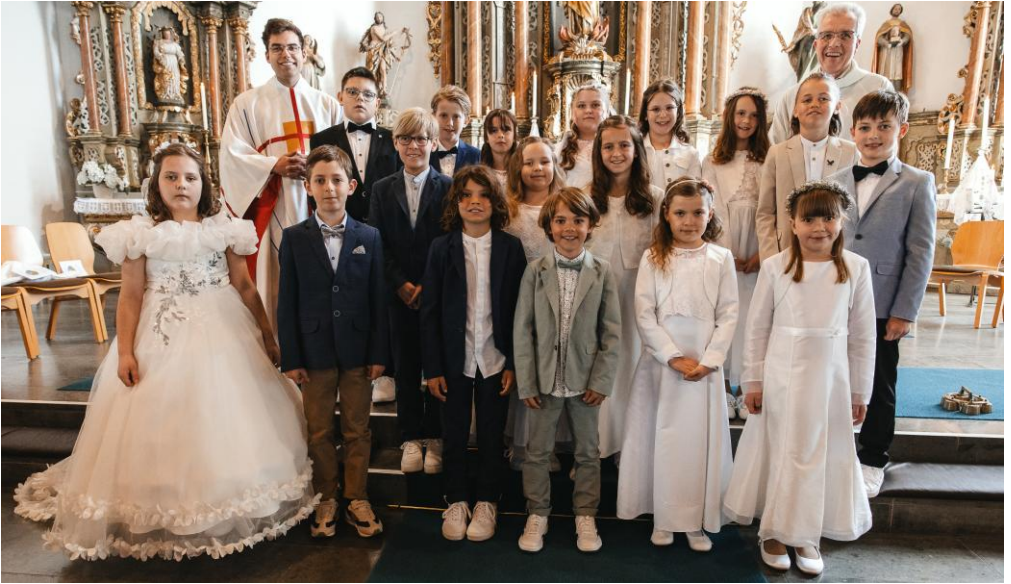
Erstkommunion in Mastershausen